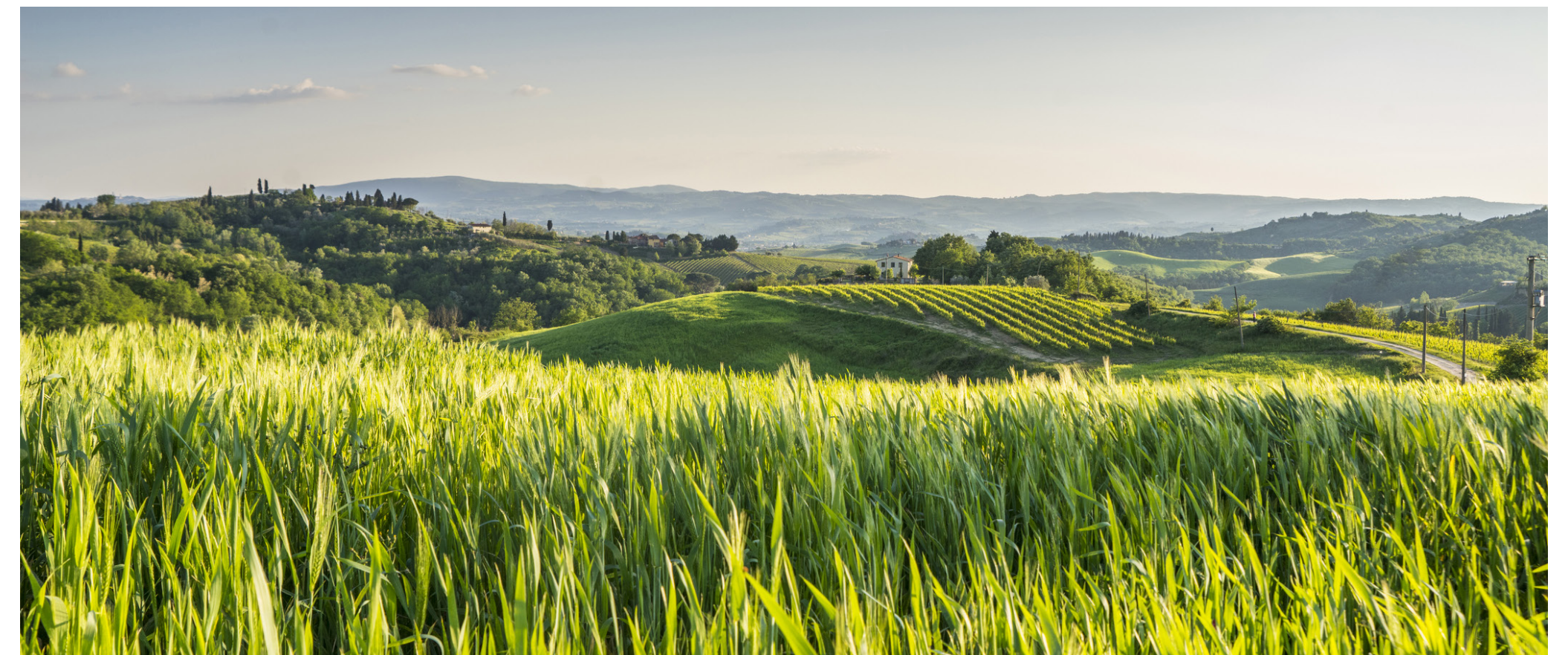
นโยบายการสื่อสารความยั่งยืนของกลุ่มบริษัท